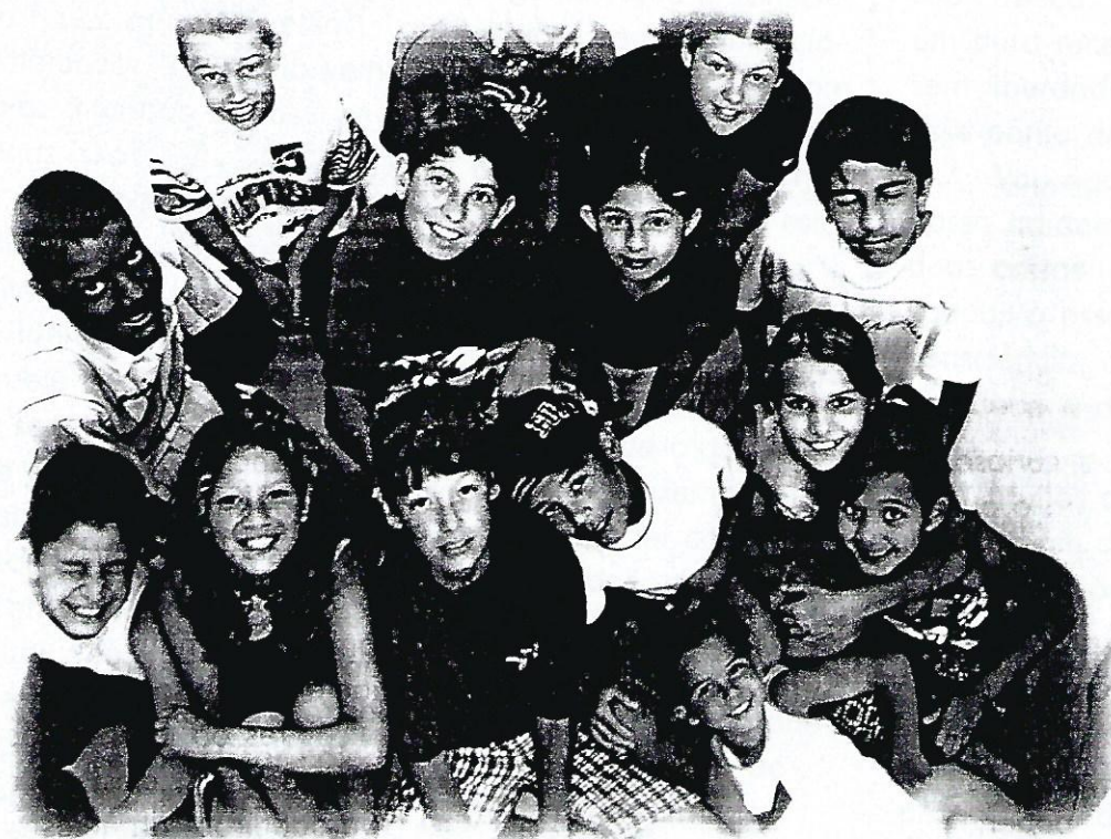
Crianças e adolescentes participam de atividade de integração

G ostaria de deixar assinalado, logo de início, que fiquei feliz e entusiasmado com o tema desse Congresso. É isso mesmo. Paulo Freire, em sua última entrevista no dia 17 de abril, 15 dias antes de morrer, dizia: "É preciso sublinhar que a utopia, o sonho não morreram; onde quer e quando quer que haja mulheres e homens, a esperança continua a fazer parte de sua natureza". A partir do tema sugerido pelos organizadores do evento, selecionei três termos que, penso, poderão nos orientar na reflexão que