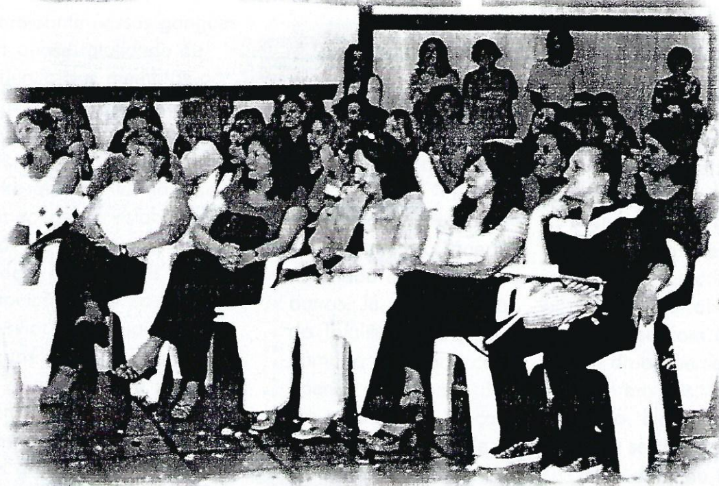
Evento marca a abertura do ano letivo 2004

por exemplo, que uma pessoa pertença a vários grupos, como certamente é o caso de todos os que estão lendo esse capítulo. Fazemos parte do grupo familiar, do grupo escolar, do grupo esportivo etc. Mas, evidentemente, não nos identificamos totalmente com nenhum desses grupos. Que acontece? Dedico ao grupo familiar, por exemplo, 50% do meu tempo, isto é, metade das relações que estabeleço e vivo no meu cotidiano formam meu grupo familiar. Ao grupo escolar dedico 10%; ao grupo esportivo 15% e assim por diante. Agora: de que se compõe, digamos assim, meu grupo familiar, escolar, esportivo? Aqui está o ponto que queria enfatizar e que, no meu entender, é possível