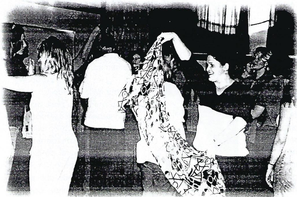
Equipe dos profissionais do Programa Vinculação em momentos de sensibilização

Outro equívoco que deve ser evitado é pensar que relação seja, ou deva ser, sempre, algo que "una", que "ligue" duas coisas. Nem sempre é assim. O conflito, por exemplo, é uma relação, como a rejeição, a exclusão. Relação, como foi dito, existe sempre que uma coisa não pode, sozinha, dar conta de sua existência,